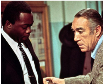
1972 MEURTRES DANS LA 110e RUE (Across 110th Street) de Barry Shear avec Y. Kotto