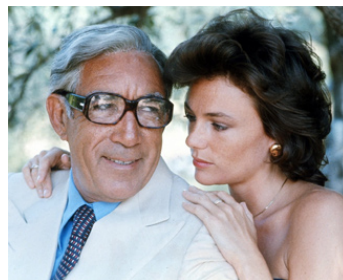
1978 L'EMPIRE DU GREC (The Greek Tycoon) de Jack Lee Thompson avec Jacqueline Bisset