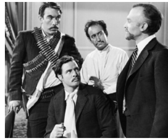
1950 VIVA ZAPATA (Viva Zapata !) d'Elia Kazan avec Marlon Brando, Fr. Silvera, Arnold Moss