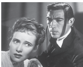
1946 SUPRÊME AVEU (The Imperfect Lady) de Lewis Allen avec Teresa Wright