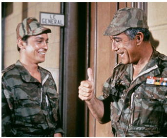
1965 LES CENTURIONS (Lost Command) de Mark Robson avec Alain Delon