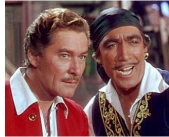
1952 À L'ABORDAGE (Against all Flags) de George Sherman avec Errol Flynn