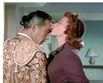
1955 LE BRAVE ET LA BELLE (The Magnificent Matador) de B.Boetticher avec Maureen O'Hara