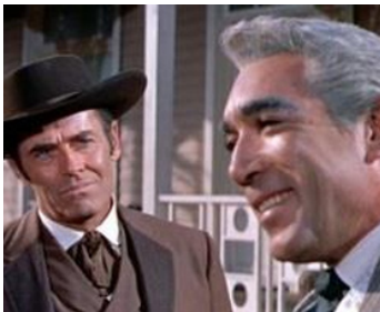
1959 L'HOMME AUX COLTS D'OR (Warlock) d'Edward Dmytryk avec Henry Fonda