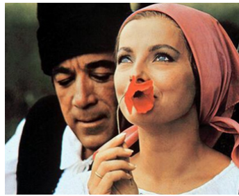
1966 LA VINGT-CINQUIÈME HEURE(The 25th Hour) d'Henri Verneuil avec Véra Lisi