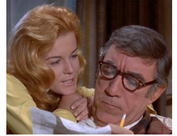
1970 R.P.M. (RPM) de Stanley Kramer avec Ann-Margret