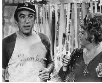
1970 L'INDIEN (The last Warrior) de Carol Reed avec Shelley Winters