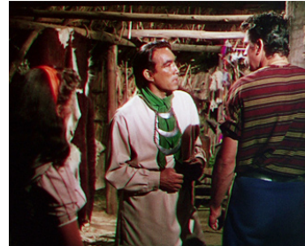
1953 L'EXPÉDITION DE FORT KING (Seminole) de Budd Boetticher avec Rock Hudson