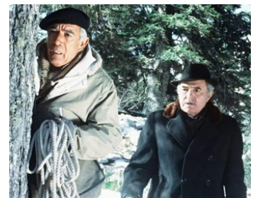
1979 PASSEUR D'HOMMES (The Passage) de Jack Lee Thompson avec James Mason