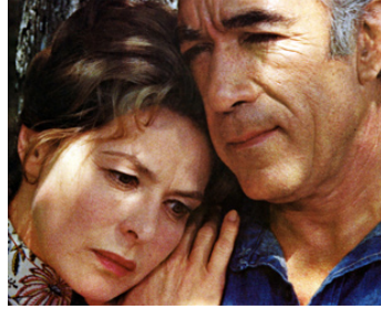
1970 PLUIE DE PRINTEMPS (Walk in the Spring Rain) de Guy Green avec Ingrid Bergman