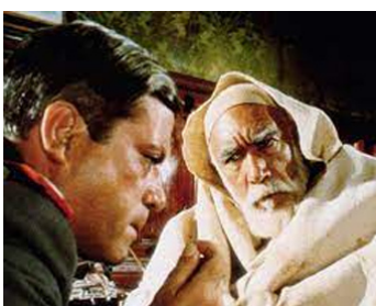
1979 LE LION DU DÉSERT (Omar Mukhtar, Lion of the Desert) de Mustapha Akkad avec O. Reed