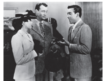
1947 TAÏKOUN (Tycoon) de Richard Wallace avec Laraine Day, John Wayne