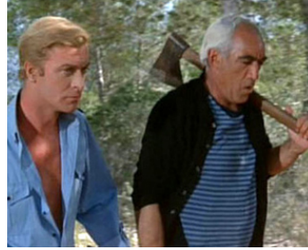
1968 JEUX PERVERS (The Magus) de Guy Green avec Michael Caine