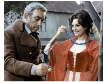
1967 PEYROL LE BOUCANIER (The Rover) de Terence Young avec Rosanna Schiaffino