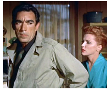
1957 LE VOYAGE HALLUCINANT (The River's Edge) d'Allan Dwan avec Debra Paget