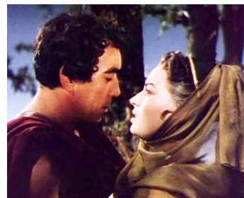
1954 ULYSSE (Ulysse) de Mario Camerini avec Silvana Mangano