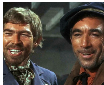
1964 CYCLONE À LA JAMAÏQUE (A high Wind in Jamaica) d'A. Mackendrick avec James Coburn