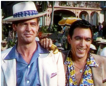
1953 LA CITÉ SOUS LA MER (City beneath the Sea) de B. Boetticher avec M. Powers, R. Ryan, S. Ball