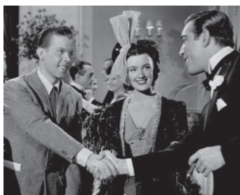
1944 POUR LES BEAUX YEUX DE MA BELLE (Irish eyes are smiling) de G. Ratoff avec D. Haymes, B. Whitney