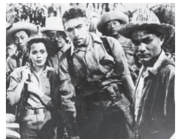
1945 RETOUR AUX PHILIPPINES (Back to Bataan) d'Edward Dmytryk avec Beulah Bondi