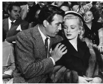
1950 LA CORRIDA DE LA PEUR (The Braves Bulls) de Robert Rossen avec Miroslava