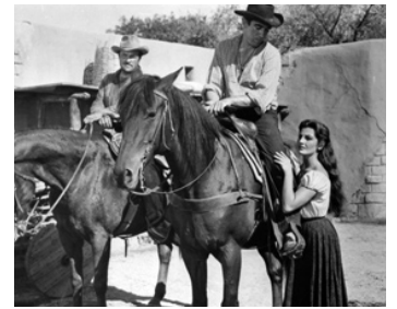
1957 LA CHEVAUCHÉE DU RETOUR (The ride back) d'Allen Miner avec William Conrad, Lita Milan