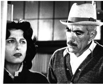
1957 CAR SAUVAGE EST LE VENT (Wild is the Wind) de George Cukor avec Anna Magnani