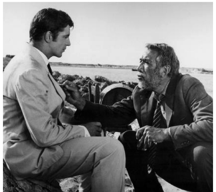
1963 ZORBA LE GREC (Zorba the Greek) de Michael Cacoyannis avec Alan Bates