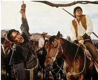
1968 LA BATAILLE DE SAN SEBASTIAN d'Henri Verneuil avec Charles Bronson