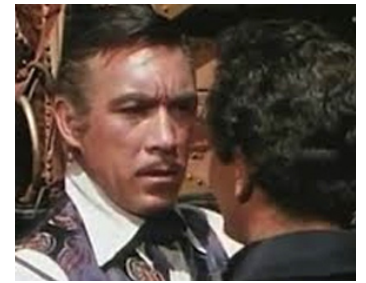
1951 L'ÉPÉE DE MONTE-CRISTO (Mask of the Avenger) de Phil Karlson avec John Derek