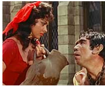
1956 NOTRE-DAME DE PARIS de Jean Delannoy avec Gina Lollobrigida