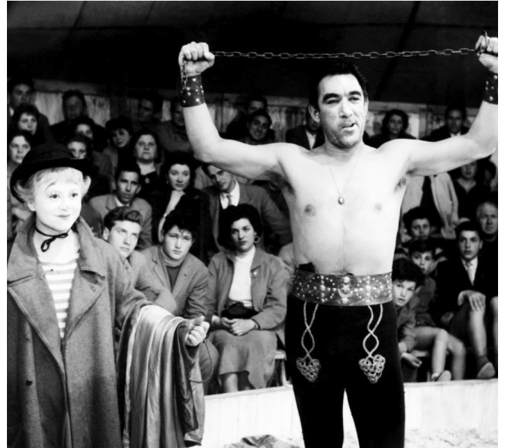
1954 LA STRADA (La Strada) de Federico Fellini avec Giuletta Masina