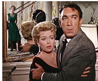
1960 MEURTRE SANS FAIRE-PART (Portrait in Black) de Michael Gordon avec Lana Turner