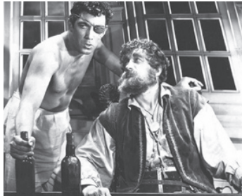
1942 LE CYGNE NOIR (The black Swan) de Henry King avec George Sanders