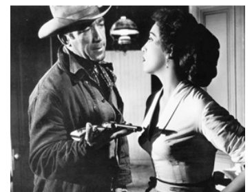
1956 MAN FROM DEL RIO de Harry Horner avec Katy Jurado