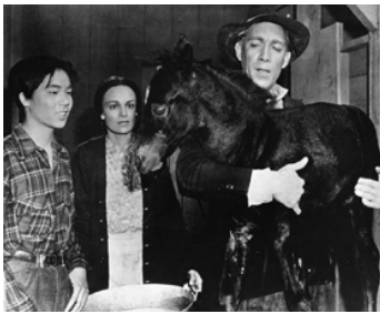
1947 L'ESPOIR NOIR (Black Gold) de Phil Karlson & B. Reeves Eason avec K. De Mille