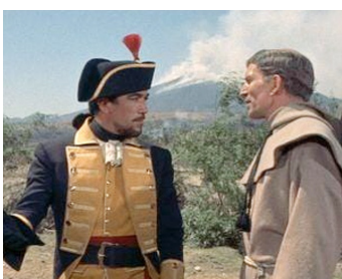
1955 LE SECRET DES 7 CITÉS (Seven Cities of Gold) de Robert Webb avec Michael Rennie