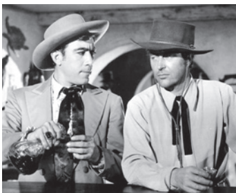
1946 CALIFORNIE TERRE PROMISE (California) de John Farrow avec Ray Milland