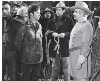
1943 L'ÉTRANGE INCIDENT (The Oxbow Incident) de W. Wellman avec D. Andrews, H. Fonda, F. Conroy