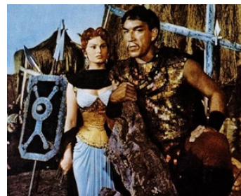
1954 ATTLA, FLÉAU DE DIEU (Attila il fiagello di Dio) de Pietro Francisci avec Sophia Loren