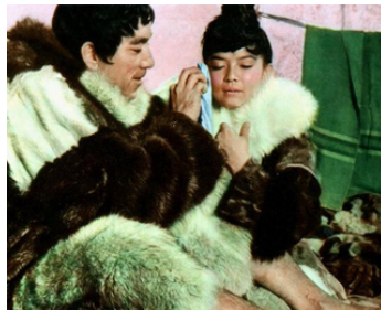
1959 LES DENTS DU DIABLE (The savage Innocents) de Nicholas Ray avec Yoko Tani