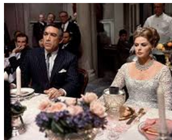
1964 LA RANCUNE (The Visit) de Bernhard Wicki avec Ingrid Bergman