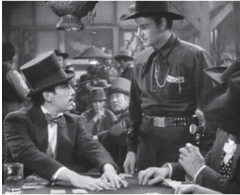
1939 PACIFIC EXPRESS (Union Pacific) de Cecil B. De Mille avec Joel McCrea