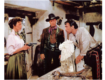
1952 VAQUERO (Ride, Vaquero !) de John Farrow avec Ava Gardner, Robert Taylor