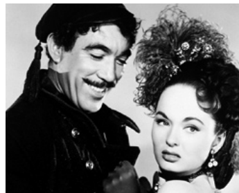
1952 LE MONDE LUI APPARTIENT (The World in this arms) de Raoul Walsh avec Ann Blyth