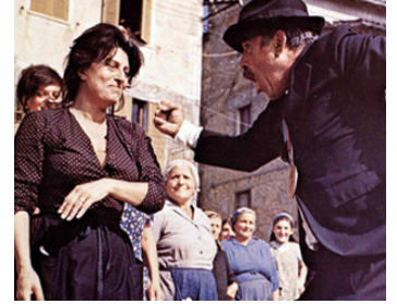
1969 LE SECRET DE SANTA VITTORIA (The Secret of Santa Vittoria) de S. Kramer avec A. Magnani