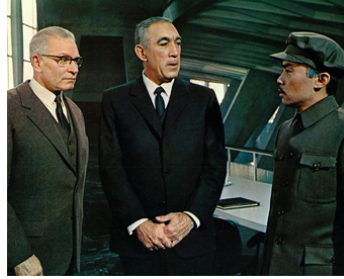
1968 LES SOULIERS DE SAINT-PIERRE (The Shoes of the Fisherman) de M. Anderson avec L. Olivier