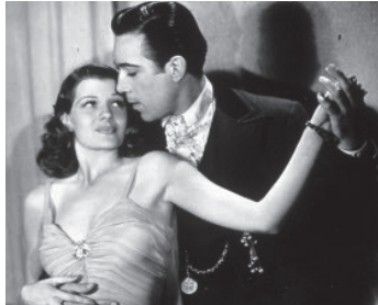
1941 ARÈNES SANGLANTES (Blood and Sand) de Rouben Mamoulian avec Rita Hayworth