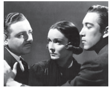
1938 DANGEREUX À CONNAÎTRE (Dangerous to know) de R. Florey avec A. Tamiroff, Gail Patrick