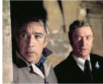
1974 MARSEILLE CONTRAT (The Destroyers) de Robert Parrish avec Michael Caine