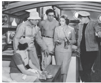
1937 L'AMOUR À WAIKIKI (Waikiki Wedding) de Frank Tuttle avec Martha Raye, Bing Crosby