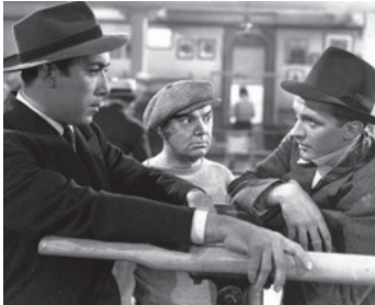
1940 DROIT AU CŒUR (Knockout) de William Clemens avec Arthur Kennedy