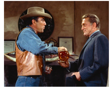
1958 LE DERNIER TRAIN DE GUN HILL (Last Train from Gun Hill) de J. Sturges avec Kirk Douglas