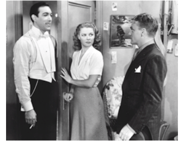
1940 VILLE CONQUISE (City for Conquest) d'A. Litvak avec Ann Sheridan, James Cagney