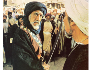
1975 LE MESSAGE (The Message) de Mustapha Akkad avec Abdallah Gheith