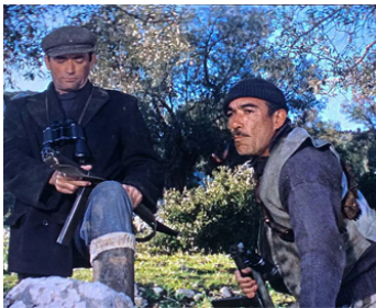
1961 LES CANONS DE NAVARONE (The Guns of Navarone) de J. Lee Thompson avec Gregory Peck