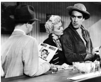
1954 NETTOYAGE PAR LE VIDE (The long Wait) de Victor Saville avec Peggy Castle