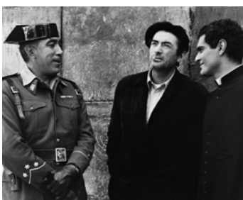
1963 ET VINT LE JOUR DE LA VENGEANCE (Behold a pale horse) de F. Zinnemann avec G. Peck, O. Sharif