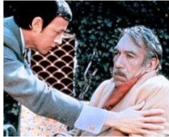
1973 DON ANGELO EST MORT (The Don is dead) de Richard Fleisher avec Robert Forster