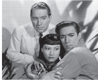
1939 L'ÎLE DES HOMMES PERDUS (Island of lost men) de K. Neumann avec J C Naish, A M Wong