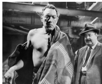
1962 REQUIEM POUR UN CHAMPION (Requiem for a Heavyweight) de R. Nelson avec W. Conrad