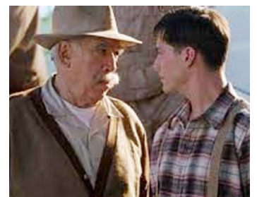
1994 LES VENDANGES DE FEU (A Walk in the Clouds) d'A. Arau avec Keanu Reeves