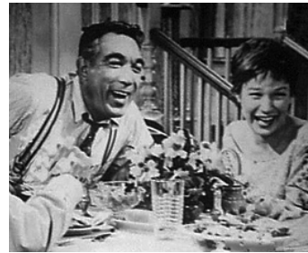
1958 VAGUE DE CHALEUR (Hot Spell) de Daniel Mann avec Shirley MacLaine