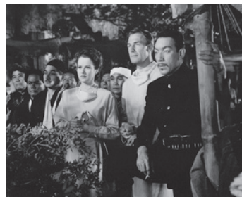
1945 SOUS LE CIEL D'ORIENT (China Sky) de Ray Enright avec Randolph Scott, Ruth Warrick