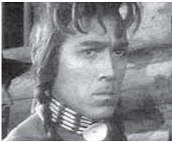
1936 UNE AVENTURE DE BUFFALO BILL (The Plainsman) de Cecil B. De Mille