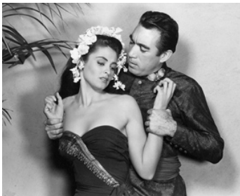
1953 À L'EST DE SUMATRA (East of Sumatra) de Budd Boetticher avec Susan Ball