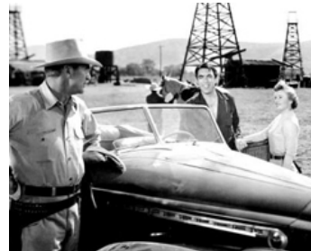
1953 LE SOUFFLE SAUVAGE (Blowing wild) d'H. Fregonese avec Gary Cooper, B.Stanwyck