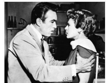
1955 LE ROI DU RACKET (The naked Street) de Maxwell Shane avec Anne Bancroft