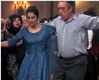
1969 A DREAM OF KINGS de Daniel Mann avec Irene Pappas