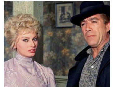
1960 LA DIABLESSE EN COLLANTS ROSES (Heller in pink Tights) de G. Cukor avec Sophia Loren