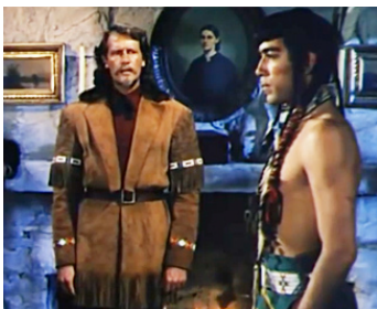
1944 BUFFALO BILL (Buffalo Bill) de William Wellman avec Joel McCrea