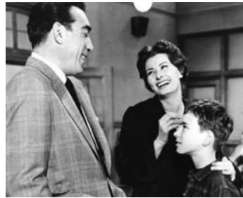
1957 L'ORCHIDÉE NOIRE (The black Orchid) de Martin Ritt avec Sophia Loren