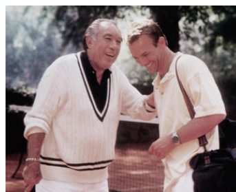
1989 REVENGE (Revenge) de Tony Scott avec Kevin Costner