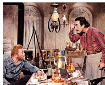
1956 LA VIE PASSIONNÉE DE VAN GOGH (Lust for Life) de V. Minnelli avec Kirk Douglas