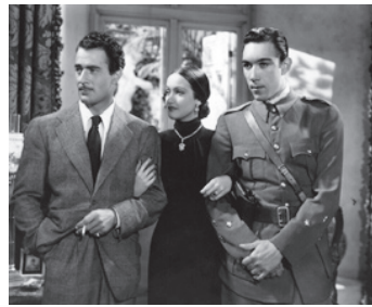
1937 LE DERNIER TRAIN DE MADRID (The last Train from Madrid) de F. Tuttle avec G. Roland, K. Morley