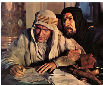
1962 LAWRENCE D'ARABIE (Lawrence of Arabia) de David Lean avec Peter O'Toole