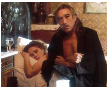
1975 L'HÉRITAGE (L'Eredita Ferramonti) de Mauro Bolognini avec Dominique Sanda