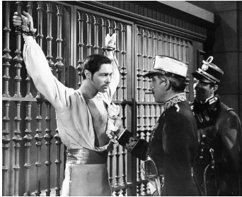
1952 LE PROSCRIT (The Brigand) de Phil Karlson avec Anthony Dexter