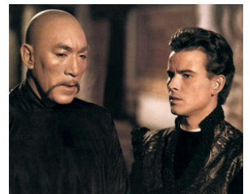
1965 LA FABULEUSE AVENTURE DE MARCO POLO de D. de la Patellière avec H. Buchholz