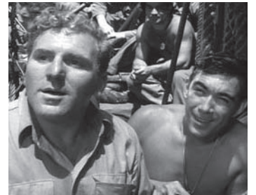
1943 GUADALCANAL (Guadalcanal Diary) de Lewis Seiler avec William Bendix