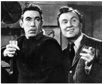
1956 LA NUIT BESTIALE (The Wild Party) de Harry Horner avec Nehemia Persoff