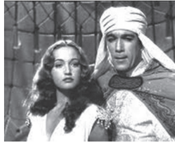
1940 EN ROUTE VERS SINGAPOUR (Road to Singapore) de V. Schertzinger avec D. Lamour