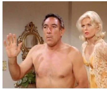
1966 LES DÉTRAQUÉS (The Happening) d'Elliott Silverstein avec Martha Hyer