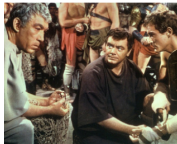
1961 BARABBAS (Barabba) de Richard Fleischer avec Ernest Borgnine, Vittorio Gassman