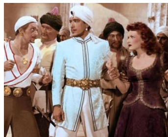
1947 SINBAD LE MARIN (Sinbad the sailor) de Richard Wallace avec Douglas Fairbanks Jr, Maureen O'Hara